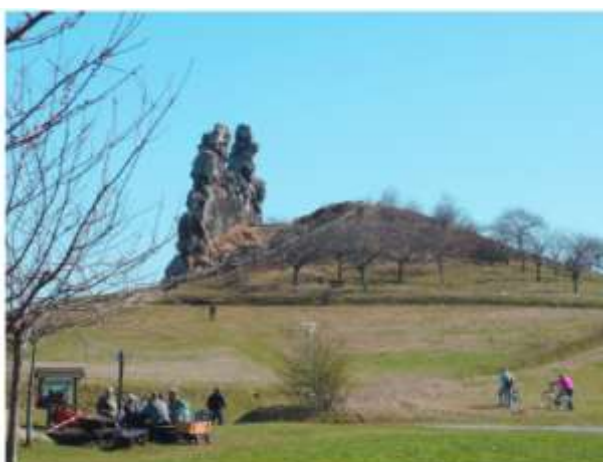
Blick auf die Teufelsmauer