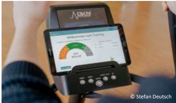
Das Team hat ein Trainingssystem entwickelt, das Menschen mit Demenz ein körperliches und geistiges Training ermöglicht.