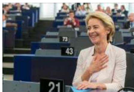
Das Europäische Parlament hat Ursula von der Leyen zur neuen Präsidentin der EU-Kommission gewählt © European Union 2019 – Source: EP"

Die gewählte Präsidentin der Europäischen Kommission wird nun die Staats- und Regierungschefs der Mitgliedstaaten auffordern, ihre Kandidaten für die Posten der Kommissionsmitglieder vorzuschlagen. Die Anhörungen der Kandidaten in den zuständigen Ausschüssen des Parlaments sind für den Zeitraum vom 30. September bis 8. Oktober vorgesehen. Das gesamte Kollegium der Kommissare muss dann vom Parlament gewählt werden, voraussichtlich auf seiner Plenarsitzung vom 21. bis 24. Oktober. Weitere Informationen finden Sie hier . • eag Quelle: PM EP